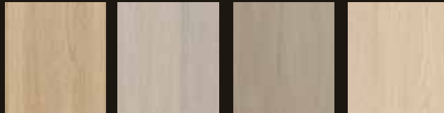
Onbehandeld 1. Grijs 2. Zilver 3. Wit

U heeft de keuze tussen onbehandeld eiken, zodat u zelf de oliekleur kunt bepalen, of eiken behandeld met 7 verschillende kleuren hardwaxolie.